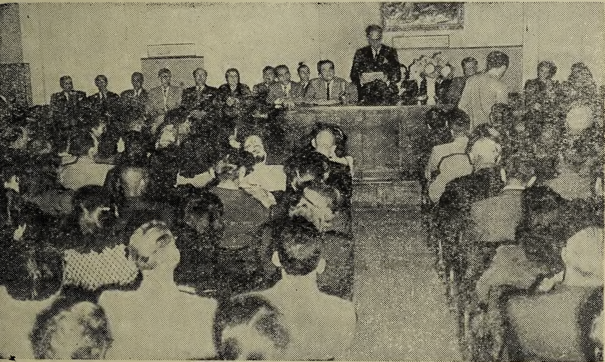
Parte da Assistência e um orador quando falava.